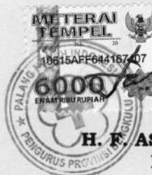
H. F. AS. ALWIE, SH Ketua

PALANG MERAH INDONESIA PROVINSI BENGKULU